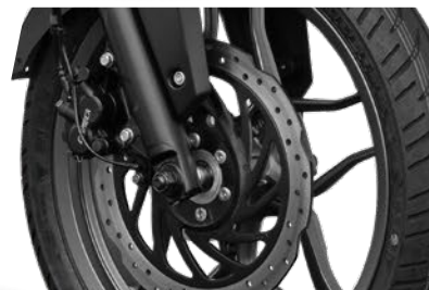
Sistema de frenos de disco Delantero 300mm, trasero 230mm.