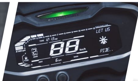
Tablero digital con conectividad Bluetooth y GPS giro a giro