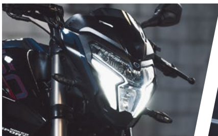
Nuevo diseño de óptica y sistema full led